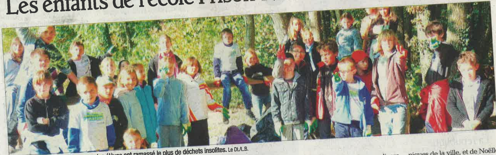
C'est dans les bois de Rosses que les élèves ont ramassé le plus de déchets insolites.

Les enfants de l'école Frison-Roche se sont élancés, dès 8h30 vendredi, sur les routes, chemins et bois de la commune à la recherche du moindre déchet. Armés de gants et de