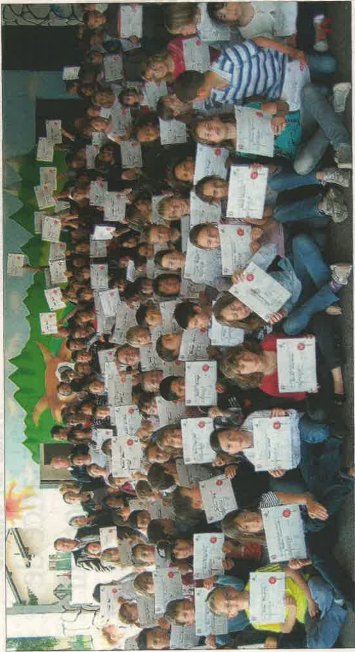
192 enfants de l'école élémentaire Frison-Roche ont passé leur permis piéton avec la police intercommunale des Voirons.