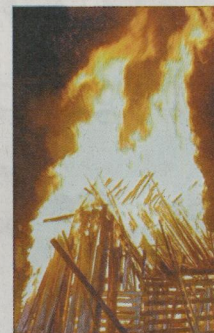
Un magnifique feu allumé par le maire et les pompiers.