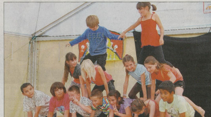
Une belle pyramide pour les élèves de l'école Frison-Roche.