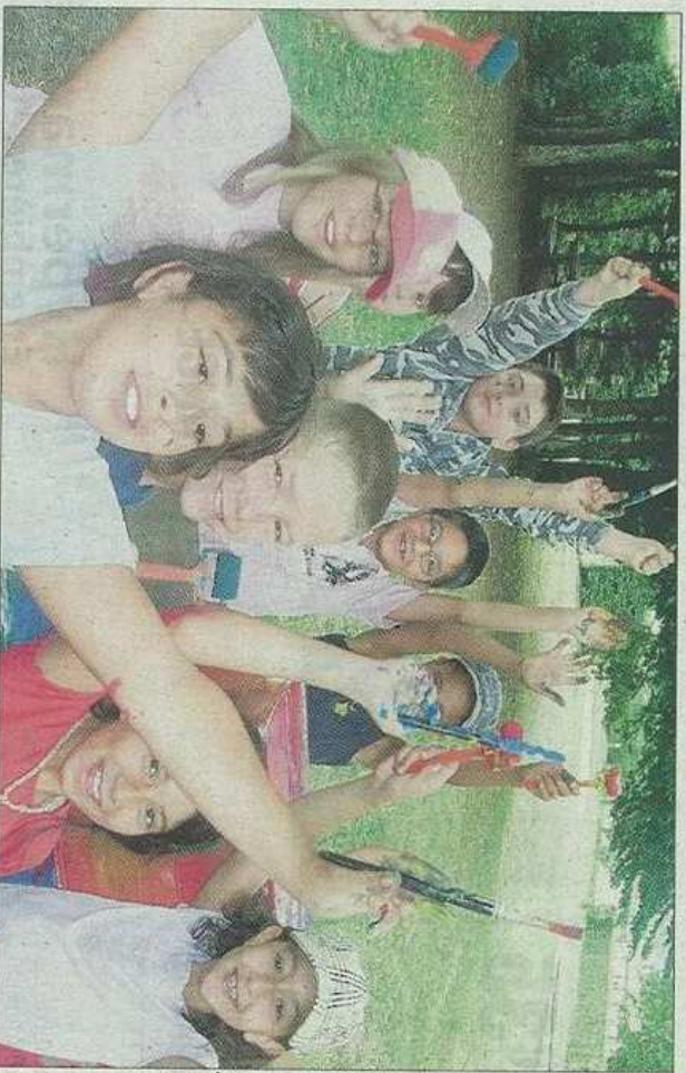
Les activités manuelles "bricoleur de la nature" font fureur chez les 9-14 ans.