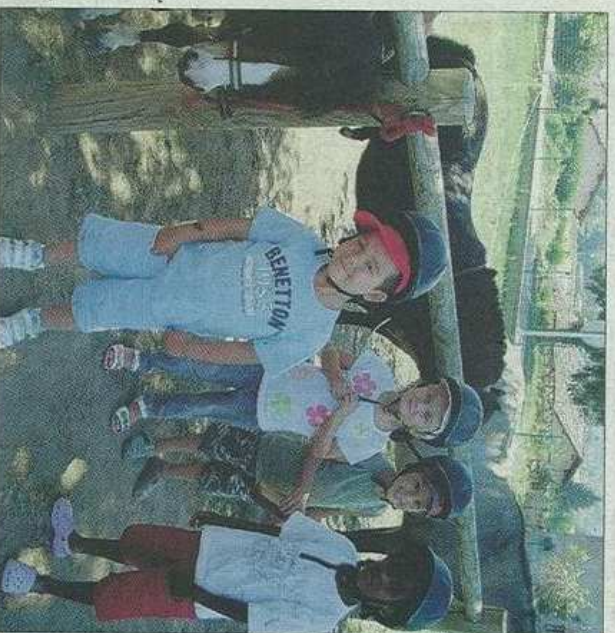
Les poneys attendent les enfants pour aller faire un tour.