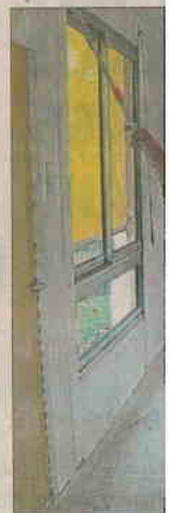
Les vacances de l'été ont été mises à profit pour rénover les locaux de l'école.

Une porte vitrée a également été posée, entre le nouveau préau et l'intérieur des locaux scolaires, permettant ainsi aux élèves, en cas de pluie, de sortir directement sous le préau.