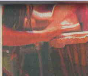
Highlight Tribe devrait mettre le feu demain soir.

internationale, proposant une belle alternative musicale entre tradition et avant-garde. Avec une musique techno sans l'aide de machine, les cinq musiciens réussissent à jouer une véritable musique trance, 100 % instrumentale, aux résonances tribales influencées par les rythmes afro, indiens, reggae, rock ou électro. Autour