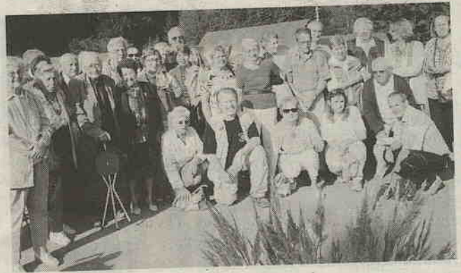
Photo souvenir du groupe qui, gâté par le temps, a profité d'une belle journée entre amis.

Quelques dizaines (près de 50 au total) de membres du club d'aînés de l'Âge d'argent ont pris la direction de la Suisse voisine le 10 septembre dernier. Au programme de cette journée placée sous le signe de la convivialité, la mine de sel de Bex dans le Valais.