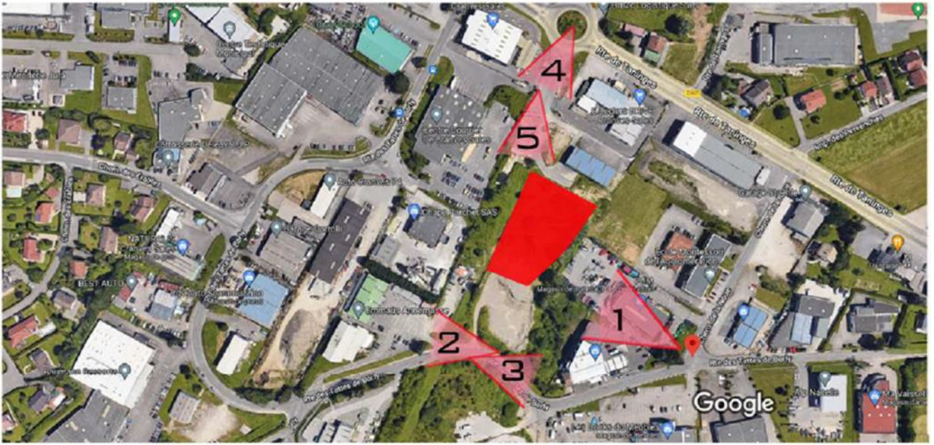
Plan de Situation / repérage des photos