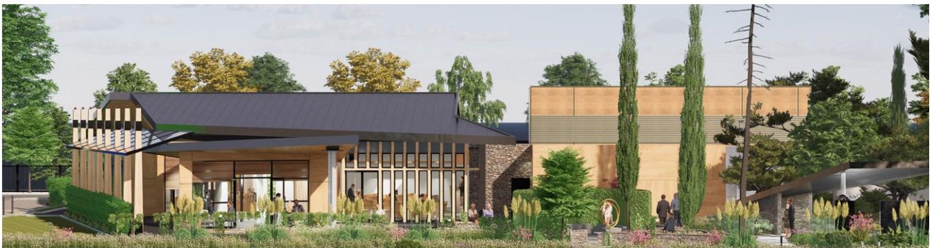
Figure 7 : Vue de la façade jardin