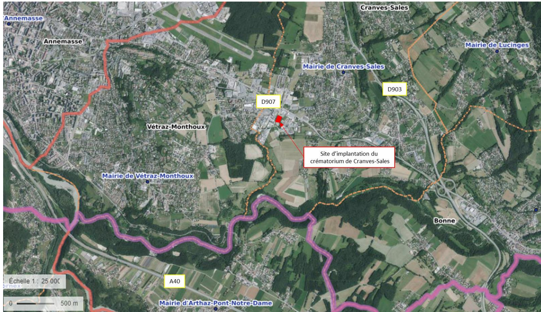
Carte 1 : Cartographie à l'échelle 1/25 000 ème