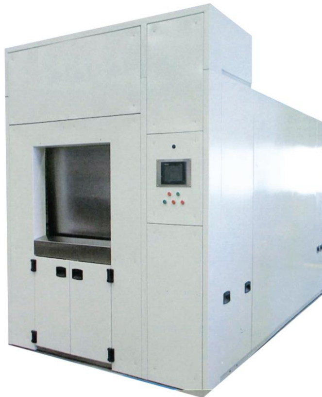
Figure 14 : Vue de l'intégration du système de crémation