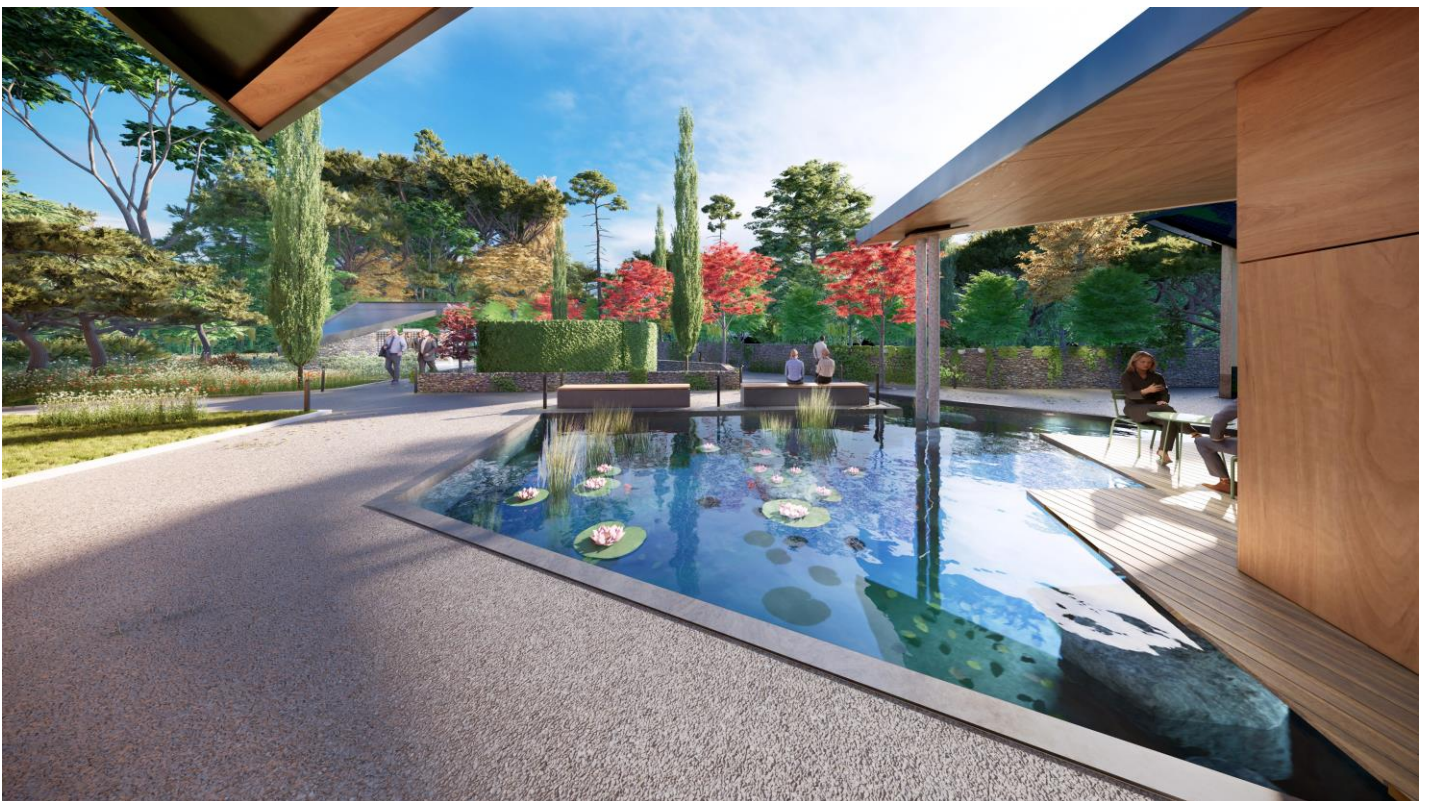
Figure 15 : Perception des aménagements paysagers

Le bâtiment sera doté d'une toiture rappelant l'architecture savoyarde. Le bois, en conformité avec la typologie régionale, sera un composant principal de la structure. L'accès au Jardin du souvenir et aux espaces arborés se fera naturellement, dans un cadre paysager et préservé, pour permettre l'intimité nécessaire au recueillement.