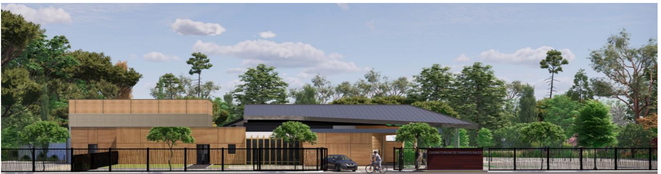
Figure 8 : Vue de la façade côté route