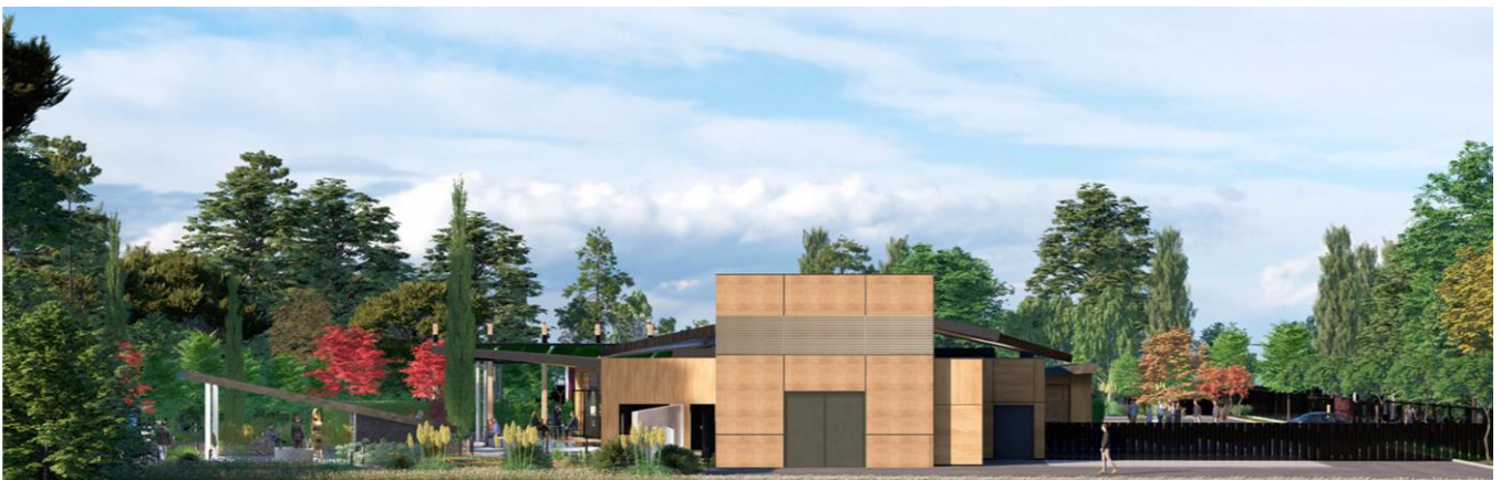
Figure 9 : Vue de la façade côté cour technique