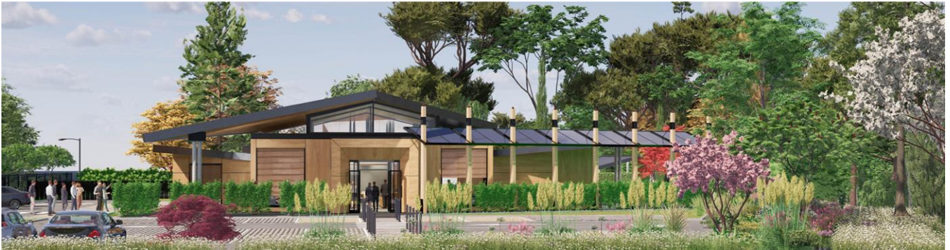
Figure 6 : Vue de la façade entrée