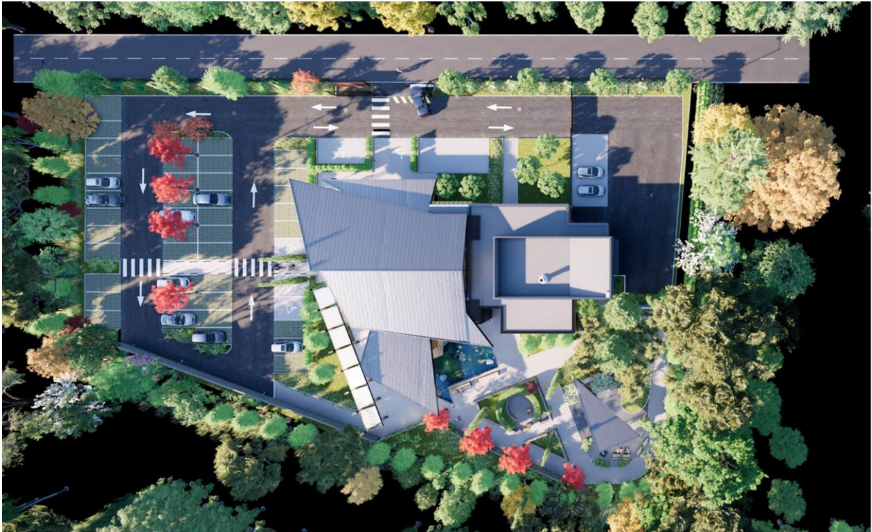
Figure 10 : Plan des extérieurs du crématorium