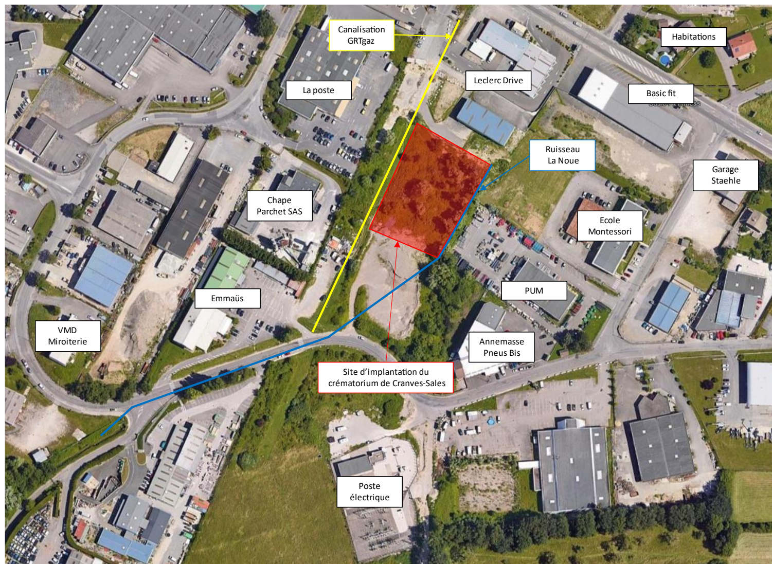
Carte 2 : Vue aérienne du site